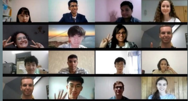
Photo from the online IPMS 2022, last year

• Call for the students as discussion leaders and oral presenters for each sessions !